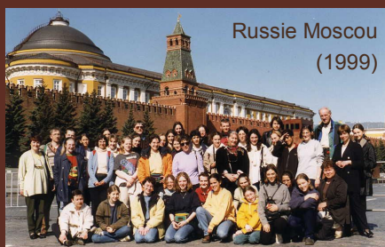
Russie Moscou (1999)