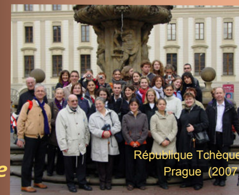
République Tchèque Prague (2007)