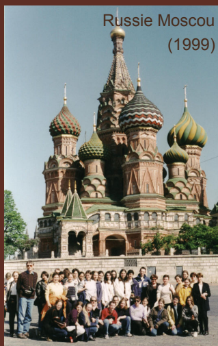
Russie Moscou (1999)

Depuis 1960, l'Orchestre de Mandolines de Remiremont participe aux concours nationaux organisés par la CMF (Confédération Musicale de France), et a gravi tous les échelons pour accéder depuis 1992 à la division Honneur (la plus élevée du classement national amateur). Il n'hésite pas à participer à des concours internationaux.