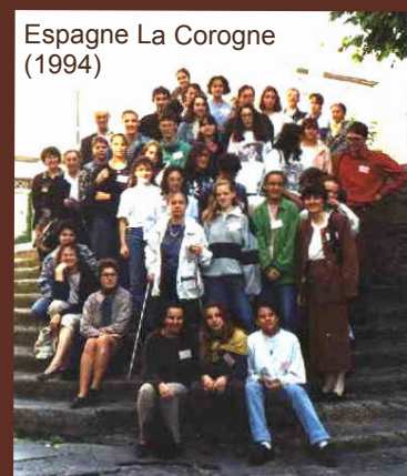
Espagne La Corogne (1994)

L'Orchestre est fier de se produire chaque printemps dans sa ville, et pour satisfaire son public, il instaure un concert de fin d'année à partir de 2013. Les élèves de l'Ecole de Musique renforcent l'Orchestre lors de ces concerts.