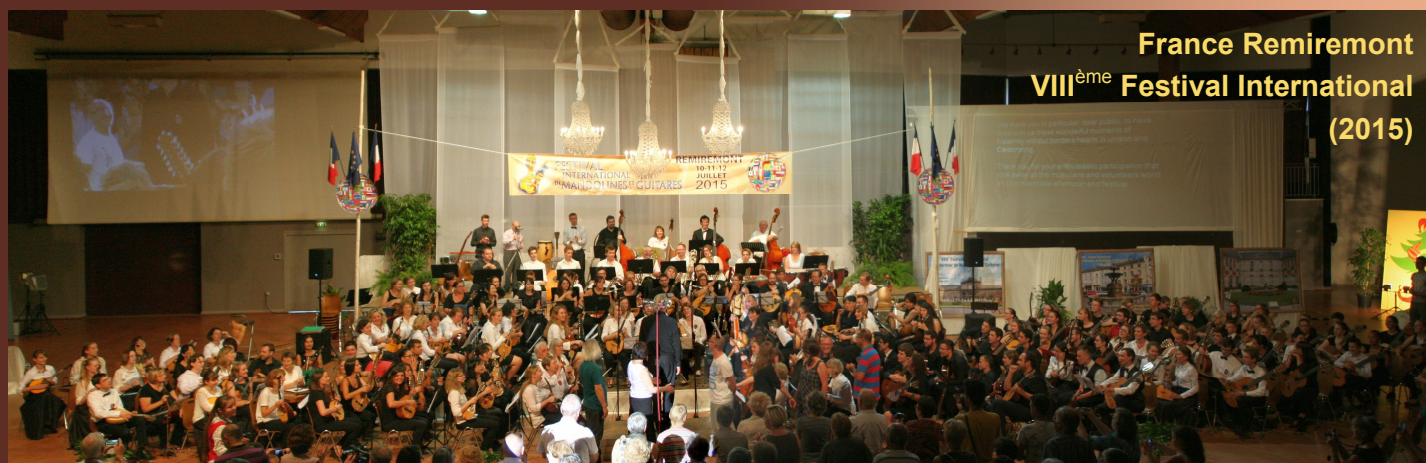
France Remiremont VIII ème Festival International (2015)