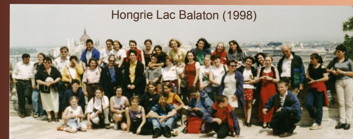
Hongrie Lac Balaton (1998)

L'Orchestre a organisé dans sa ville 2 rencontres nationales des Orchestres à Plectres (2011 pour la seconde), ainsi que plusieurs festivals internationaux d'Orchestres de Mandolines et Guitares. Celui de juillet 2015 (8 ème ), rassemblait plus de 200 musiciens de 10 nationalités (Allemagne, Autriche, Biélorussie, Bulgarie, Espagne, Japon, Luxembourg, Pays Bas, République Tchèque, et France). Rendez-vous les 10-11-12 Juillet 2020 pour la 9 ème édition !