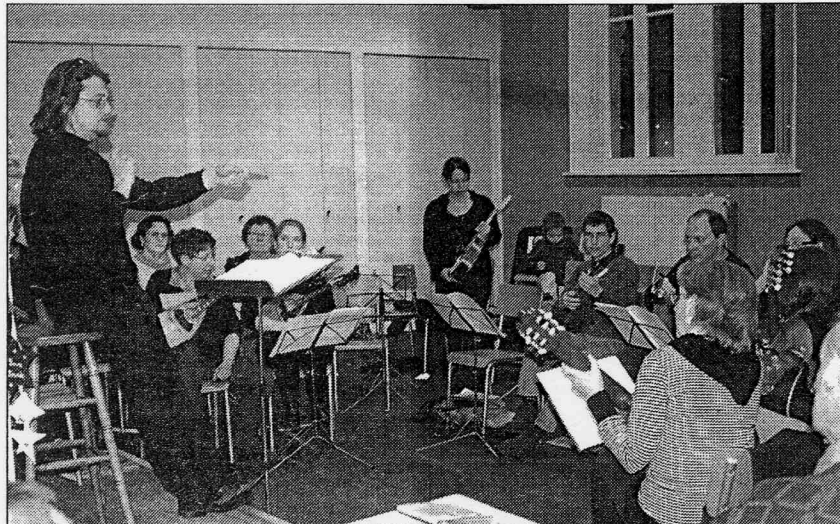
Le compositeur écoute et conseille

Durant notre conversation nous découvrons qu'il y a très peu de musiciens professionnels de mandolines en France :